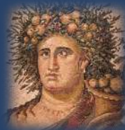
Alix Senator © Mangin-Démarez, Casterman

À l' agrégation d'ESPAGNOL , la 4 e épreuve d'admission est une explication orale sur un texte de LATIN, portugais ou catalan : il est donc judicieux de se préparer en amont. Le latin est également un atout lors de l'épreuve d'admissibilité de linguistique, où la phonétique évolutive repose bien souvent sur la connaissance d'un étymon latin